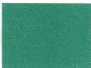
8 - VERDE GIADA 8 - JADE GREEN