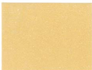
1 - GIALLO LINO 1 - LINEN YELLOW

All SPECTRA colours may be used pure or mixed together or with our CYBERLUX, LUMEN, NEOCOLOR, NEOCOLOR HOBBY and KALEIDOS with the possibility to obtain numberless intermediate colours and special shades. In order to satisfy the modern taste of elegant decorations for interior-exterior walls, it is possible to mix SPECTRA with our acrylic neutral transparent glaze VELATURA.