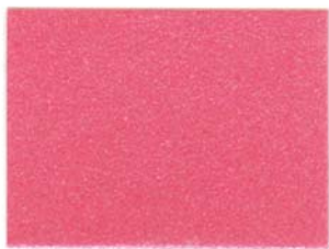
5 - ROSA TRAMONTO 5 - SUNSET PINK