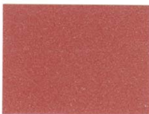
4 - TERRA DI SIENA 4 - SIENNA