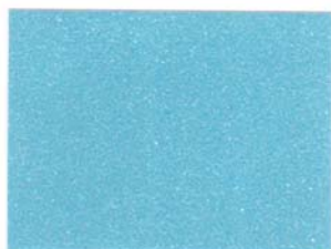
9 - AZZURRO CIELO 9 - SKY BLUE