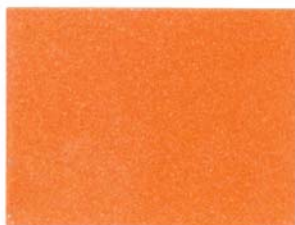
3 - ARANCIO CALIPSO 3 - CALYPSO ORANGE