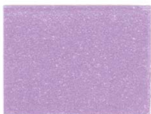
11 - SETA LILLA 11 - LILAC SILK