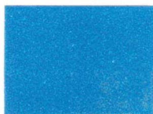
10 - AZZURRO TROPICI 10 - TROPIC BLUE