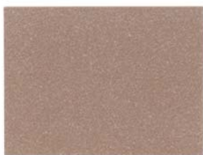
2 - ZIBELLINO 2 - SABLE